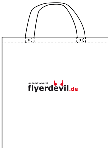
Motiv 2-farbig (Beispiel)