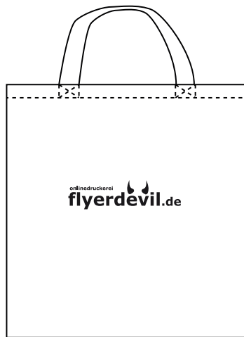
Motiv 1-farbig (Beispiel)