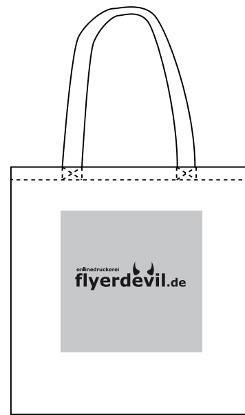
Druckbereich auf dem Produkt